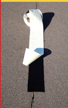
Qwikseal en largeur de 2 1/2 ou 4 pouces

L'application est facile, juste à nettoyer la surface avec un jet d'air et s'assurer que c'est propre et sec, dérouler le rouleau Qwikseal et appliquer. Chauffer légèrement les côtés assure une bonne adhésion du produit. Installé correctement, Qwikseal prévient les infiltrations d'eau qui cause la détérioration de la chaussée.